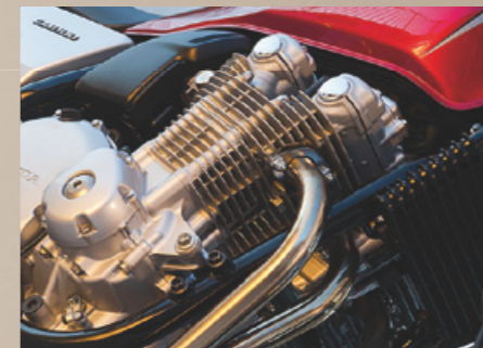
VÝKON ŘADOVÉHO ČTYŘVÁLCE